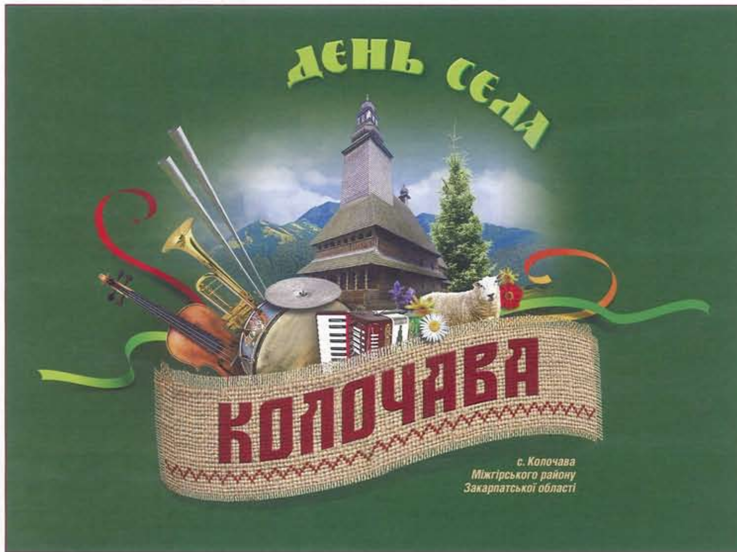
с. Колочава Міжгірського району Закарпатської області