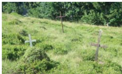
Могили колочавських «революціонерів».

За словами колочавських старожилів, безіменні поховання 1918–1920 рр. «революціонерів» років у Колочаві розташовані поблизу могили Миколи Шугая, де в той час здійснювалися поховання селян.