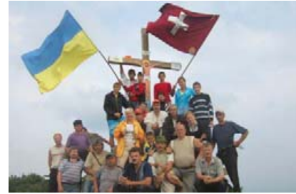
На вершині гори Стримба. Серпень 2009 року.