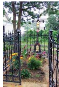
Могила угорського поштаря.

Поруч із чеськими могилами на подвір'ї Святодухівської церкви під деревом є поховання угорця – поштаря і касира, який виплачував гроші тодішнім бокорашам. Рік поховання – 1914, причина смерті – серцевий напад. Огорожу встановили угорські родичі, вона збереглася до наших днів.