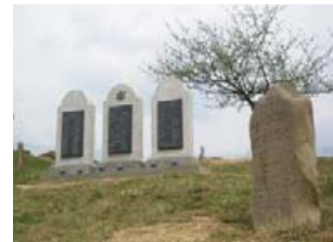
Пам'ятні стели колочавським євреям. Автор В. Шиндра.

і Закарпаття Менахем Мендель Тайхман та представники БОФ «Хесед Шпіра».