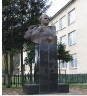
Пам'ятник І. Ольбрахту. Скульптор М. Белень.

На будинку сільської ради, ще з радянських часів, висить меморіальна дошка, на якій написано: «В с. Колочава в 1931 році жив Іван Ольбрахт – один із засновників Комуністичної партії Чехословаччини. Письменник». Іван Ольбрахт (справжнє ім'я – Каміл Земан) народився 6 січня 1882 року у Семітах в Чехії, в родині адвоката Антоніна Земана. Закінчив гімназію, а 1906 року – юридичний факультет Празького університету. 1920 року Ольбрахт нелегально перебував у Москві, де збирав матеріал для майбутніх «Нарисів про сучасну Росію». Революційне повітря Росії надихнуло Ольбрахта на політичну діяльність. Повернувшись на батьківщину, він стає одним із засновників комуністичної партії Чехословаччини і редактором її друкованого органу – газети «Руде право». Одним із