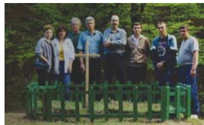
Ініціативна група після облаштування могил.

Могили упорядковані ініціативною групою з числа випускників колочавської школи 1978 року.