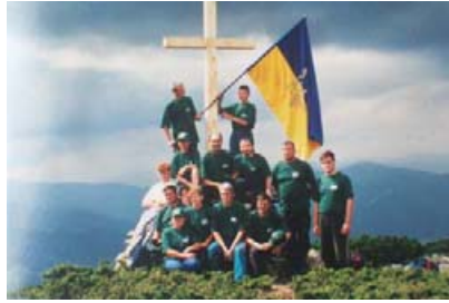
На вершині гори Стримба. Серпень 2001 року.

Сьогодні на висоті 1719 метрів хрест стоїть над Колочавою як знак Божого заступництва та допомоги.