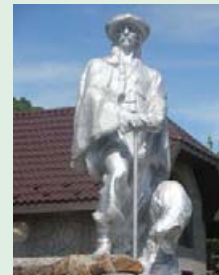
Пам'ятник вівчарю. Скульптор І. Вітка.

Вівчарство було найдавнішим заняттям людей у Карпатах. З усіх свійських тварин візці були найбільш підходящими для гірської зони, де півроку тривала зима. Тому вони стали улюбленими тваринами в господарствах верховинців. Недарма пам'ятник вівчарю донині прикрашає центр села Колочава.