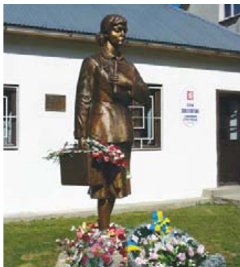
Пам'ятник вчительці з України. Скульптор П. Штаєр.

Та 15 вчительок назавжди обрали Коложаву своєю другою домівкою. Саме їхні прізвища викарбувані на коложавському пам'ятнику «Вчителька з України».