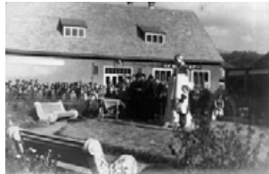
Сквер ім. Леніна. Фото 60-х років.