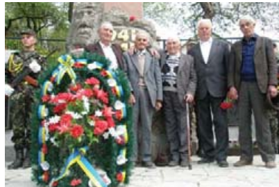
На відкритті відреставрованого обеліску разом воїни радянської, чехословацької і угорської армії.

Всі ці колочавці загинули на одній війні і всі вони зараз вшановані разом. Колочава стала першим прикладом такого Примирення на Закарпатті.