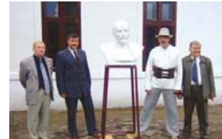
Реконструйований Ленін біля музею «Стара школа».