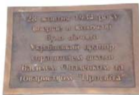
Меморіальна дошка на фасаді музею «Чеська школа».

Активісти товариства «Просвіта» стали провідниками національно-визвольного руху на Закарпатті і керівниками уряду Карпатської України у 1938–1939 роках.