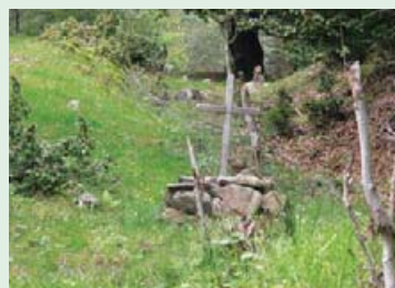
Могила чехословацького десантника до реконструкції.

В Гирсовці словака-десантника, який переховувався, помітила дівчина і повідомила про це священника. Наступного дня угорські жандарми схопили розвідника і розстріляли у зворі поблизу Бринзійового млина (початок Мерешора). Одночасно вони наказали не ховати його в землі, щоб всі бачили, яке покарання чекає на того, хто наважиться на подібні дії проти угорської армії. На місці його загибелі 2003 року встановлено пам'ятний хрест.