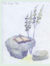
Ескіз скульптурної композиції рукопису Івана Лугоша. Автор В. Шиндра.

Факт встановлення скульптурної композиції повинен стати своєрідною відповіддю чеському письменнику Івану Ольбрахту на його слова, написані в 30-х роках минулого століття, що Колочава – це «... село XI ст., в якому ще не винайшли плуг...», «... Африка у центрі Європи». Можливо, І. Ольбрахт навмисно не хотів на сторінках своїх романів і публікацій бачити освічених і прагматичних колочавців? Очевидно, що фантазія і сенсації були більше до вподоби тодішнім європейським читачам, ніж розповіді про 200-річчя колочавських рукописів. Але, завдячуючи творчості І. Ольбрахта, світ дізнався про Колочаву. Нехай і бунтівну та неписьменну!