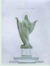
Ескіз пам'ятника Ісусу Христу.