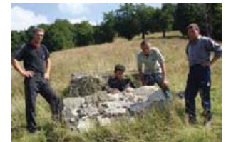
Залишки пам'ятника на Менчулі. Фото 2009 р.

У червні 2010 року планується відкриття нового обеліску, що буде зрештою та встановлений на цьому місці силами колочавської ініціативної групи.