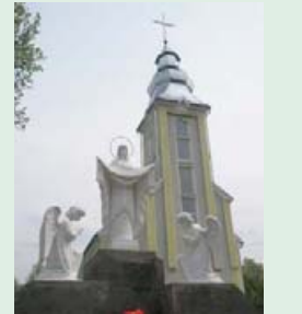
Скульптурна композиція «Покрова Пресвятої Богородиці». Скульптор П.Штаєр.

Православна громада цього року теж отримала подарунок від П.Штаєра – скульптурну композицію «Ісус Христос».