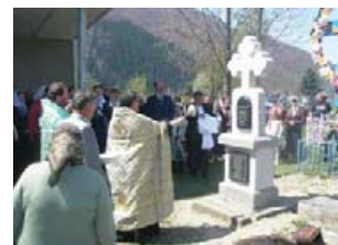
Освячення пам'ятника загиблим колочавцям у таборах ГУЛАГу. Автор В. Шиндра.

*ГУЛАГ – Головне управління виправно-трудових таборів і трудових поселень НКВС СРСР. Концентраційні табори Сталінського режиму.