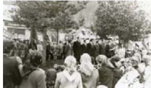
Урочистості біля пам'ятника Леніну. Фото 60-х років.

перенесений у фойє новобудованої школи. В часи незалежності бюст Леніна перенесли на шкільний склад. З відкриттям у вересні 2006 року музейного комплексу «Стара школа», Ленін отримав нову «прописку» у Колочаві, і тепер бажаючі фотографуються біля нього.