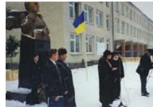
Відкриття пам'ятника І. Ольбрахту.