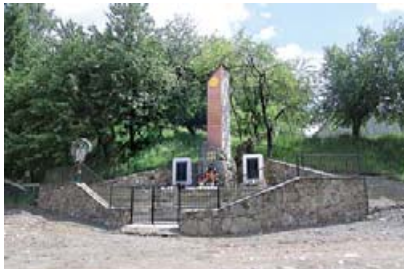
Відреставрований обеліск з уточненими списками загиблих.