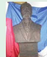
Бюст Президента Чехословацької республіки Масарика.

Погруддя першого Президента Чехословацької республіки Томаша Гарика Масарика потрапило до коложавського музею «Чеська школа» завдяки самим чехам. Директор музею Яна Камєньскова, що у місті Пжерові, доктор Франтішек Гибел разом із численним чеським шкільним приладдям подарував новоствореному 2007 року у Коложаві музею і погруддя Президента. Відтоді «батько» Чехословацької республіки стоїть на почесному місці у класній кімнаті музею. Над ним височіє його вічно актуальний вислів: «Скажи мені, що ти читаєш, і я скажу тобі, хто ти є», поруч державний прапор Чехословаччини.