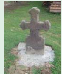
Могила невідомого на території Святодухівської церкви XVII ст.

Біля дерев'яної церкви Святого Духа ще й досі збереглося чимало таких поховань. Одне із них – невідома могила під деревом, яка не містить ніяких підписів. У селі панує думка, що там лежить якийсь відомий колочавський меценат. Дослідження зі встановлення прізвища продовжуються.