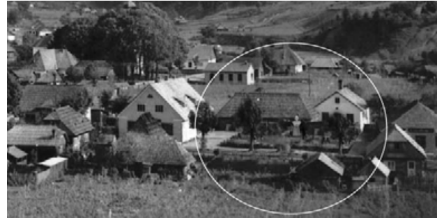
Сквер ім. Леніна (реконструйовано за допомогою комп'ютерної програми Photoshop).