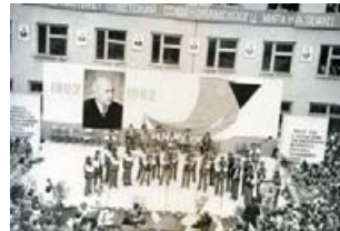
Святкування 100-ї річниці з дня народження І. Ольбрахта на шкільному подвір'ї.