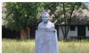
Пам'ятник Олександрі Духнович. Скульптор О. Мондич.

Постамент із погруддям культурно-освітньому діячеві Олександрі Духнович поставило у Колочаві товариство ім. О. Духновича – організація русофільської орієнтації, культурно-просвітницька робота якої в краї спрямовувалась проти «нижньої української національності» та бойкоту всього, що не мало «руський характер».