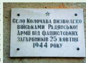
Меморіальна дошка на фасаді сільради.

З цього можна зробити висновок, що село Колочава звільнено Червоною Армією 15, а не 25 жовтня, як вважалося в радянські часи.