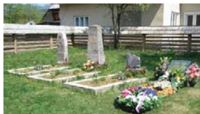
Могили та пам'ятна дошка громадян тодішньої Чехословаччини.