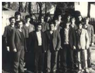
Колочавські «афганці». Фото 1990 р.

В Афганістані приймали участь у бойових діях – 23 колочавці, в Чехослова-