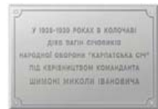
Ескіз меморіальної дошки колочавським січовикам.