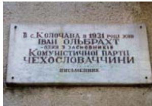
Меморіальна дошка І. Ольбрахту на будинку сільради.

Готуючись до 100-річчя з дня народження чеського комуніста і письменника Івана Ольбрахта, радянське керівництво на Закарпатті розробило широкомасштабний план заходів з цієї нагоди. В рамках святкування було підготовлено до друку книгу Івана Долгоша «Колочава», в якій було викладено творчий шлях Ольбрахта на Закарпатті, особливо під час його перебування в селі Колочава у 1931–1936 роках; було закладено пам'ятний знак в с. Колочава на місці майбутньої скульптурної композиції чеському письменнику; було відкрито шкільний музей ім. І. Ольбрахта. Саме в Коложаві були проведені всі державні урочистості з нагоди 100-ї річниці. Фестиваль україно-чехословацької культури тривав декілька днів. Кульмінацією свята стало закладення гранітної плити з написом «Тут буде встановлено пам'ятний знак Івану Ольбрахту». Святкові заходи закінчилися, а згодом радянська влада забула про обіцянки. Лише через 18 років пригадав про пам'ятник Ольбрахту Геннадій Москаль, тодішній голова Закарпатської обласної держадміністрації. Саме завдячуючи йому у листопаді 2000 року було відкрито пам'ятник. Відкриття пройшло тихо і без особливого пафосу. Автором скульптурної композиції став закарпатський митець Михайло Белень.